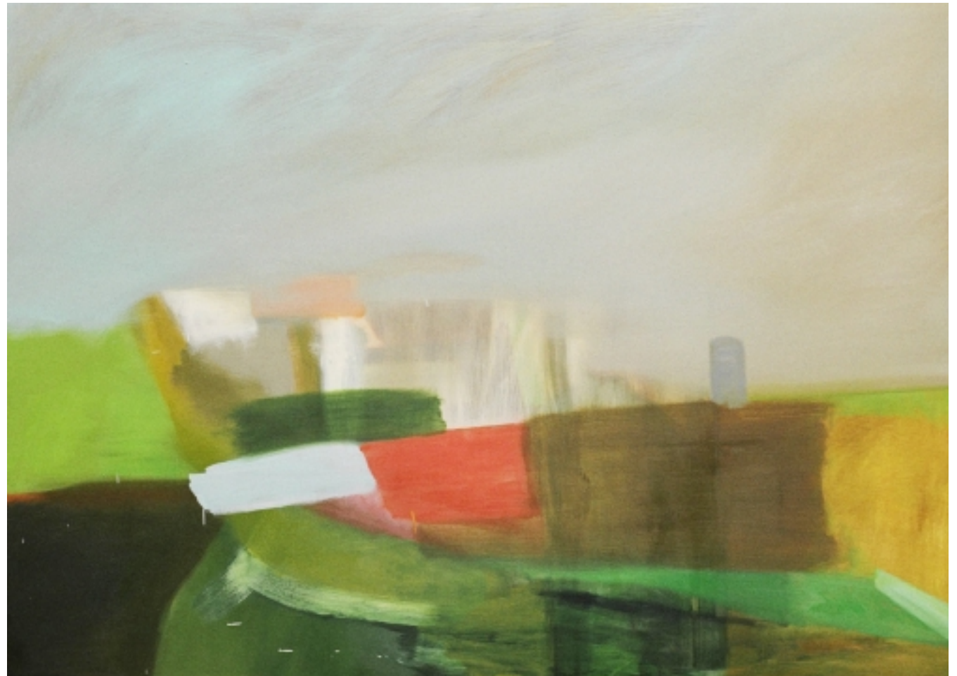
Xavier Martin "P05-AB" Huile sur toile, 100 cm x 120 cm, 2005.

Galerie Paolo Boselli http://paoloboselli.biz