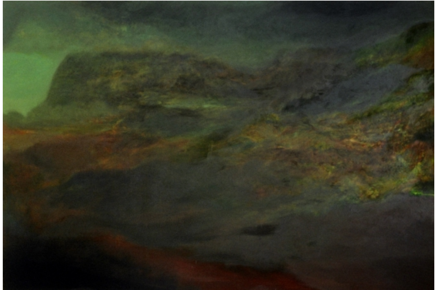
Xavier Martin "Paysage II" Huile sur toile 200 cm x 300 cm 2004.

Galerie Paolo Boselli http://paoloboselli.biz