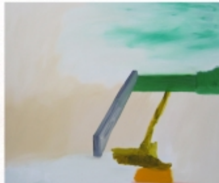
P-04-BO-6, Mur, Huile sur toile, 2004