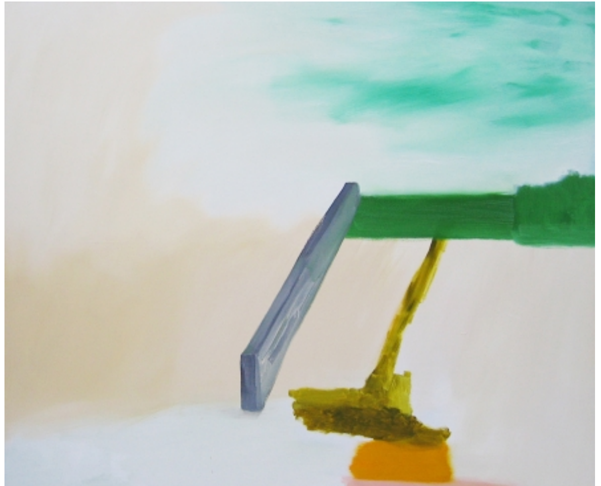
Xavier Martin "P04-BO-6-MUR 1" Huile sur toile, 100 cm x 120 cm, 2004.

Galerie Paolo Boselli http://paoloboselli.biz