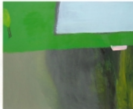
P-04-BO-8, Piscine 3, Huile sur toile, 2004

La galerie du Botanique propose une exposition du jeune peintre Xavier Martin, révélé au public lors de l'édition 2003 du Prix de la Jeune Peinture belge. Des œuvres inspirées par la tradition asiatique, mais participant pleinement d'une démarche contemporaine.